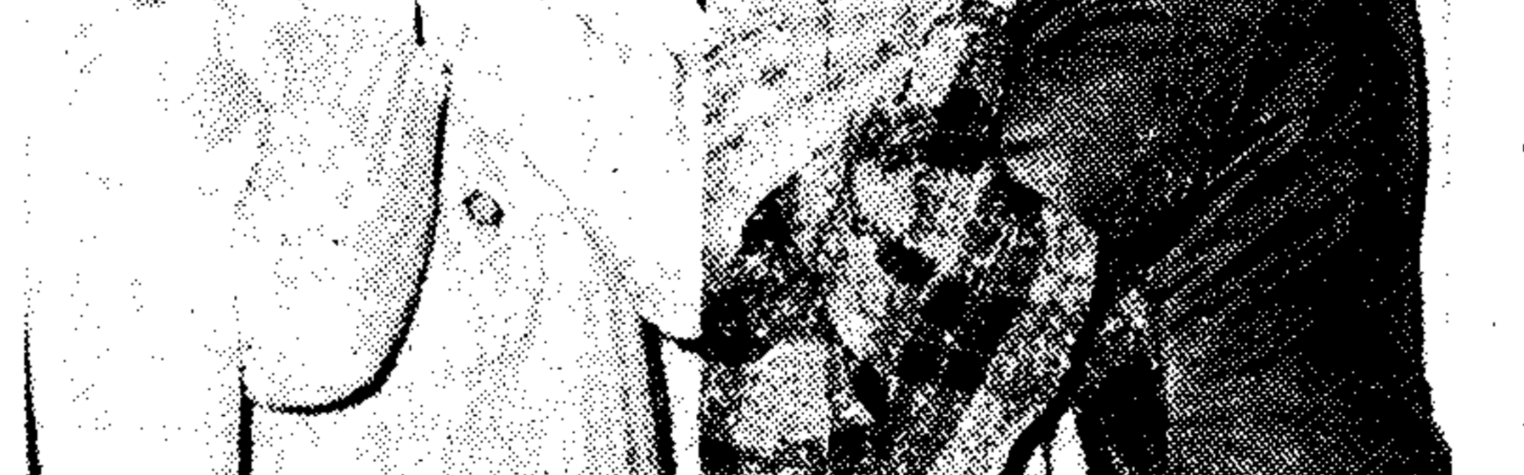
Συγγενείς των θυμάτων θρηνούν τους άγαπημένους τους, Σαρναντατέριες οίκογένειες κερωνοβολήθηκαν, και μαζί τους θλίβεται όλόκληρος ο 'Ελληνικός λαός.

Φαίνεται πράγματι πώς ή άνακρίση για την ύπόθεση του φοβερού ναυαγίου θα τελειώσει σε ένα χρόνο - ρεκόρ. Ού είναι ή δεύτερη έπίθεση ταχύτητος μετά την ταχεία όργάνωση του έργου της διασώσεως των ναυαγών, ή οποία εκδηλώθηκε άμέσως μετά το δυστύχημα. Τά πάντα γύρω από την ύπόθεση φαίνεται πως κινούνται σε γρήγορο ρυθμό. Όλοι διάξιοντες να ξεκαθαρίση ή ύπόθεση. Οι άρχες για να εκδώσουν τά πρώτα και να καταλογίσουν ευθύνες. Το 'Αρχηγείο Ναυτικού από εύλογη ευαισθησία για την άπώλεια 44 ψυχών, για τη μνημή των όποιων άποφάσεις τριμερού πενθός. Η έταιρία του δεκαμεσολογίου, τέλος, ή οποία έχει άνειλημμένες ύποχρεώσεις και πρέπει, όπως λέγεται, να διεύξη το σμυταύλαμα του πλοίου της από τον Πειραιά.