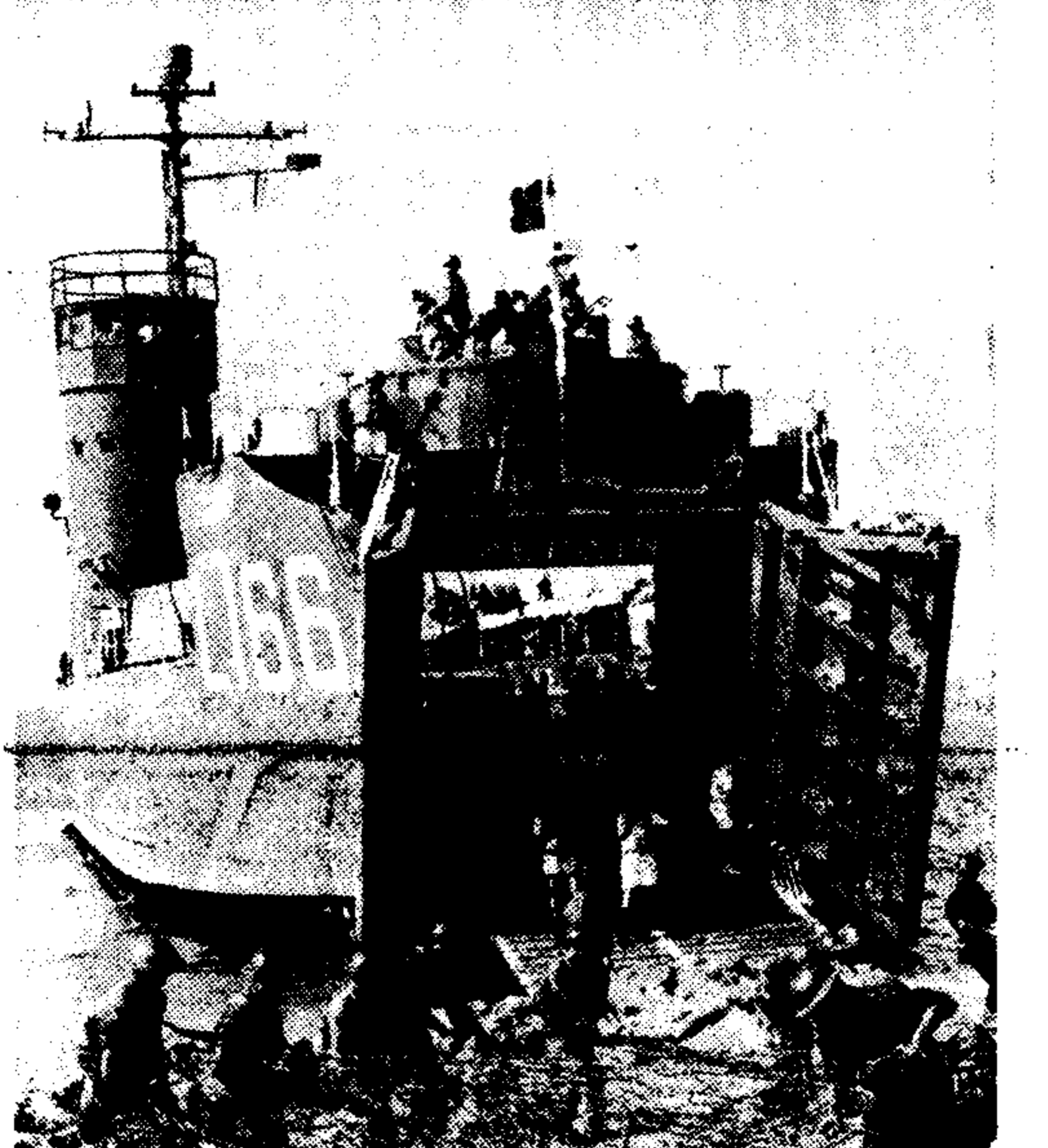
Το τραγικό άρματαπλοίο του Στόλου «Μέρλιν» L-166, που βρίσκεται στο βυθό του Σαρωνικού, φέρτερο 43 ανδρών του Ναυτικού. Φωτογραφία από μίαν απόδοτική άσκηση.